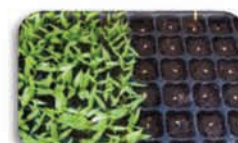
Ψεκασμός πριν από τη σπορά 0,5-1 g/m 2 de δίσκοι 50-100gr/στρ.

ΠΡΟΣΟΧΗ: Τα φυτοπροστατευτικά προϊόντα να χρησιμοποιούνται με ασφαλή τρόπο. Να διαβάσετε πάντα την ετικέτα και τις πληροφορίες σχετικά με το προϊόν πριν από τη χρήση.