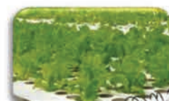
Βύθιση φυτωρίων ή μοσχευμάτων 2 g/L νερού