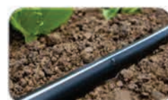
Στάγδην άρδευση 50-100gr/στρ.